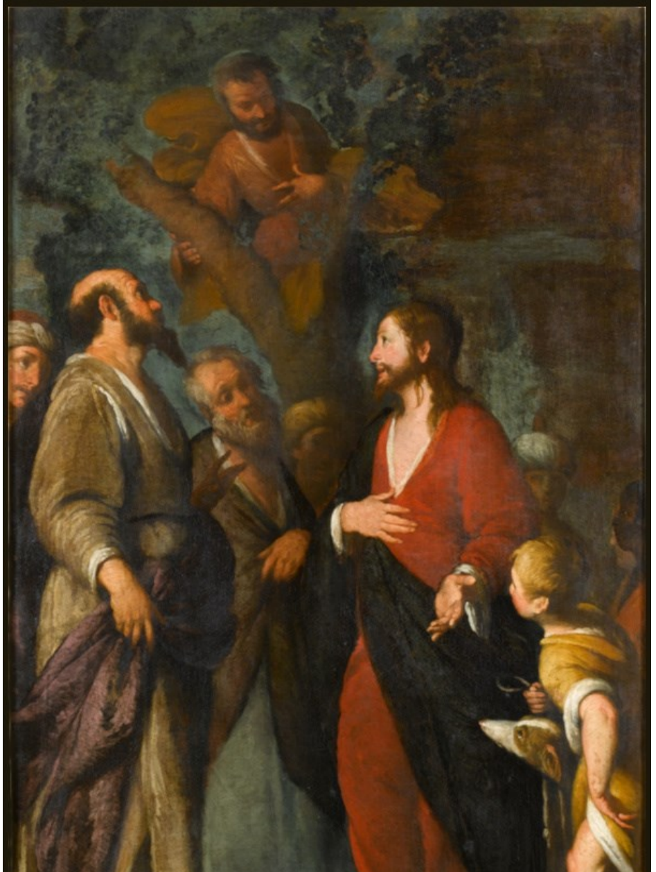
Bernardo Strozzi, The Conversation of Zacchaeus , (17th Century), Musee des beaux-arts, France

Please contact the parish office to request the visit of a priest to the home or hospital of someone who is ill and in need of the sacraments. Holy Communion for those who are homebound is also available upon request.