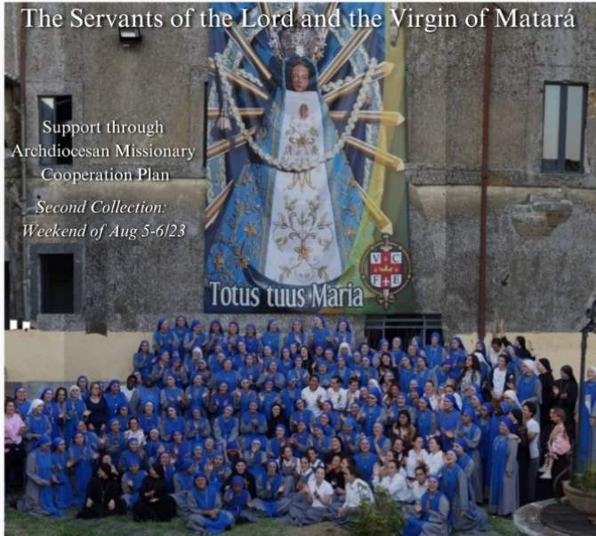
The Servants of the Lord and the Virgin of Matará

Support through Archdiocesan Missionary Cooperation Plan Second Collection: Weekend of Aug 5-6/23