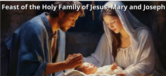
Feast of the Holy Family of Jesus, Mary and Joseph

Join us live December 31, 2023 at 12PM to celebrate the Feast of the Holy Family of Jesus, Mary and Joseph