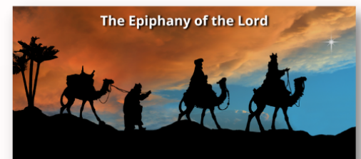
The Epiphany of the Lord